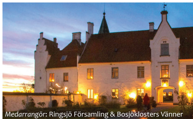
Medarrangör: Ringsjö Församling & Bosjöklosters Vänner

första adventshelgen 30 november - 2 december fre-lör 11:00-17:00, sön 11:00-16:00