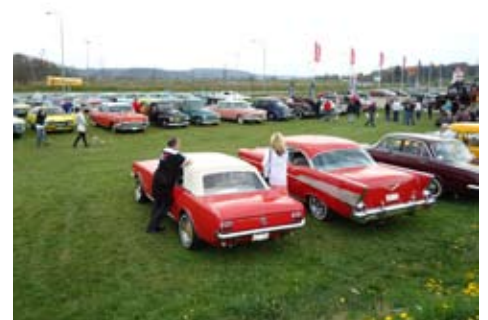
Vid målet i Veddige