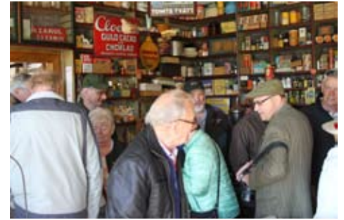
Det var trångt i affären.

tillhandahöll lunchen. Vi blev bjudna på helstekt kotlettryg och fiskgratäng. Naturligtvis fick vi också massor av sall-