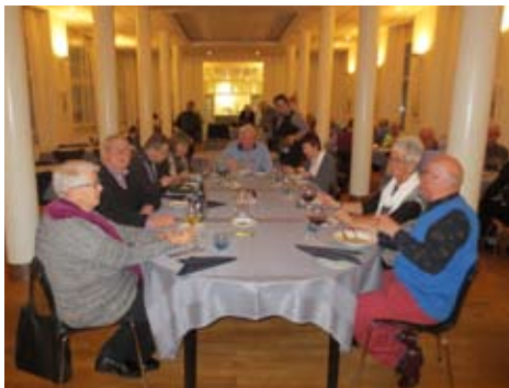
Fredagskvällens middag intogs i vacker matsal.