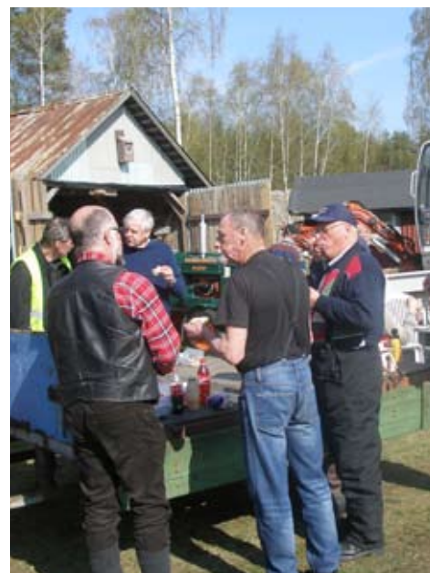
Det var trångt runt grillen

Efter någon timmas korvgrillning, kaffedrickande och snackande så avslutades en fantastiskt trevlig och försommarvarm dag och deltagarna tog sin mopeder och begav sig hemåt.