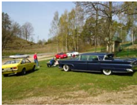
Fikapaus på Solbackens festplats