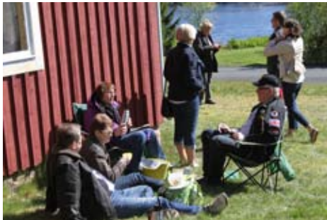
Det var riktigt skönt i lä.

gång, levnad och sedan, 1970, nedläggning. Efter historieberättande delades vi upp i grupper då alla 100 HFV-are (inklusive medpassagerare) inte rymdes samtidigt i den ganska trånga butiken. Under tiden vi väntade på vår tur passade flertalet på att dricka medhavt kaffe med tillugg. Det var varmt, soligt och vindstilla om man höll sig vid husgaveln men i vinden var det kyligt.