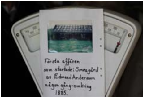
Butiken öppnade 1885.

gång, levnad och sedan, 1970, nedläggning. Efter historieberättande delades vi upp i grupper då alla 100 HFV-are (inklusive medpassagerare) inte rymdes samtidigt i den ganska trånga butiken. Under tiden vi väntade på vår tur passade flertalet på att dricka medhavt kaffe med tillugg. Det var varmt, soligt och vindstilla om man höll sig vid husgaveln men i vinden var det kyligt.