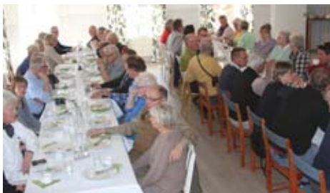
Trivsamt vid långborden.

Vi hade startat 09.20 från Ica Vallås och 12.30 började vi sista etappen på vår resa, Timmershult till Torups Gästgiveri som