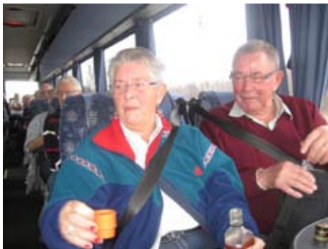
Glada miner i bussen.