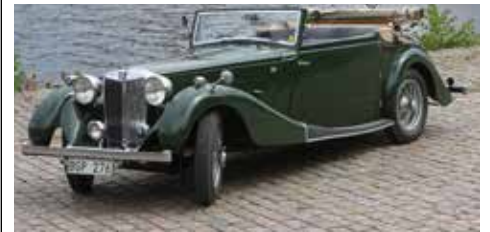
Per Svengren MG SA 1936 Text o foto Arne Åkerblom