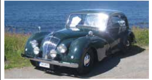
Bosse Lundqvist med sin AC,

Lite bilder från pressvisning inför Halmstad Sportsarmmeeting. 3 HFV medlemmar syntes: