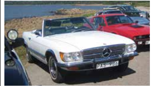
Rune Nilsson MB450 SL.