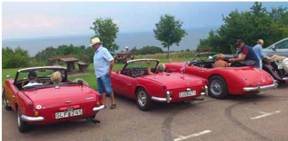
Här är vi vid utsiktsplatsparkeringen längs Italienska vägen strax ovanför Båstad