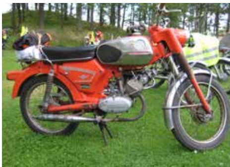
En orörd Zyndapp.

Grillen är igång och när vi har gått runt i anläggningen är det dags att lägga på maten man har med sig, vi sitter i en härlig miljö och bara njuter.