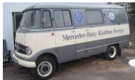
Mercedeklubbens nyrenoverade buss stod och glänste på parkeringen