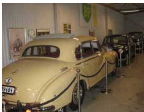
"Filmbilen", var från början en svart Adenauer som lackades gul inför en filminspelning