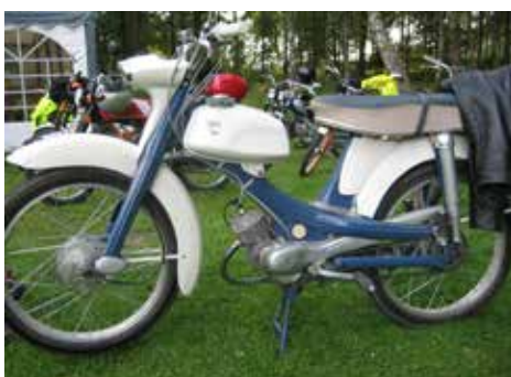
En NSU i fint skick.