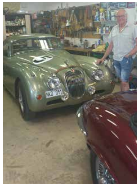
Tage vid sin ögonsten, en minituöst renoverad XK 150 Coupé

var högst motvilligt vi fortsatte vår resa mot nya äventyr i Värmland.