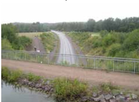
En akvedukt över landsvägen

fick se inte bara bilar utan gamla TV- och radioapparater, kameror samt olika telefoner och en hel del annat. Kul att se att utvecklingen gått framåt inte bara på bilsidan. Ett välordnat museum som inte var så stort till ytan men ändå kändes