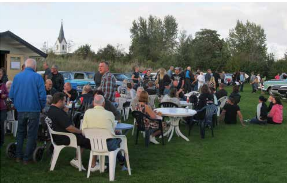
Bild från Veddige träffen 2014-09-04. Som alltid många bilar o massa trevliga "Bil kompisar". De serverar fika billigt o gott (hembakt). Träffen är varannan torsdag. Gå in på deras sida "Torsdagsträffen Veddige" för mer information

En träff där alla fordon är välkomna Det brukar vara Amerikanare, Europeiska bilar, Hot Rod, MC, Mopeder och ibland Traktor o Lastbilar