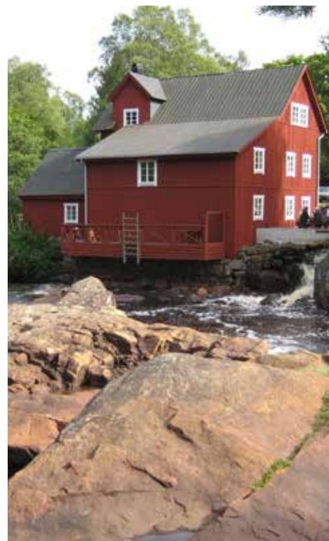
Den gamla kvarnen ligger fantastiskt vackert vid Krokån och är ett populärt utflyktsmål.

Den 5 september samlades 19 st rutinerade mopedister vid Lagagården i Laholm för att köra längs slingriga vägar till Sveriges sannolikt minsta bryggeri, Brovikens Bryggeri, som finns i Knäreds