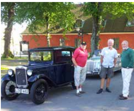
18 juni var det dags igen och då körde ett 20-tal personer till Haverdal för att inta medhavd fika och njuta av solens sakta dalande ner i havet.