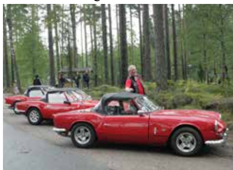
Några av Tvååkersbilarna