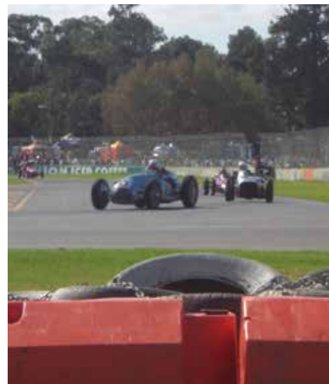
Här en bild från ett veteran-uppvisningsrace, som jag besökte. Här kör dom på samma bana som Clipsal 500 vilket är ett stort race i Adelaide.