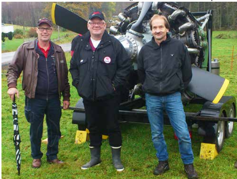
Tre halvdöva men glada HFV-are poserar framför flygmotorn.

När vi kom till marknaden så gick vi omkring och tittade efter de utlovade motorena men hittade inga och undrade därför om inga fanns, men så hördes ett mäktigt muller. Det var en stridsvagnsmotor som startade på andra sidan vägen, den röt så att marken skakade, men så var den också på hela 750 hkr, en Rolls Royce Meteor MK4B med en slagvolym på hela 27 liter.