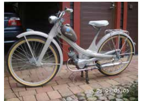
Bernts fina NSU moped

sin dar jag skulle med det skrotet till. Så småningom blev det 5 fina NSU-are samt en Kreidler och en Monarped.