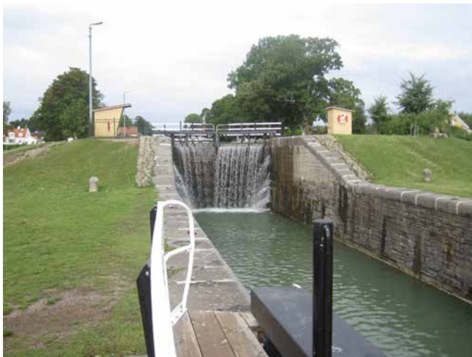
Bergs slussar strax utanför Linköping, sju slussar i rad för att lyfta/sänka båtarna