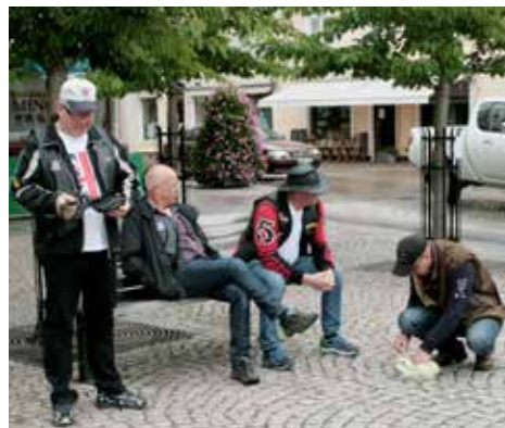
Tvååkers-"gubbarna" på Stortorget