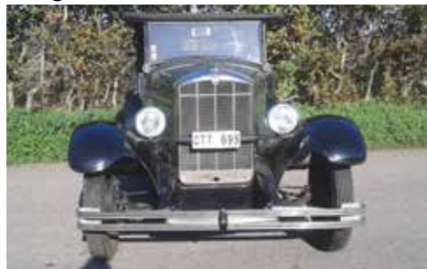
Rugbyn rakt framifrån

Motorn är 4-cylindrig och på hela 36 mycket dragvilliga hästkrafter och 3-växlad låda samt naturligtvis även försedd med backväxel.