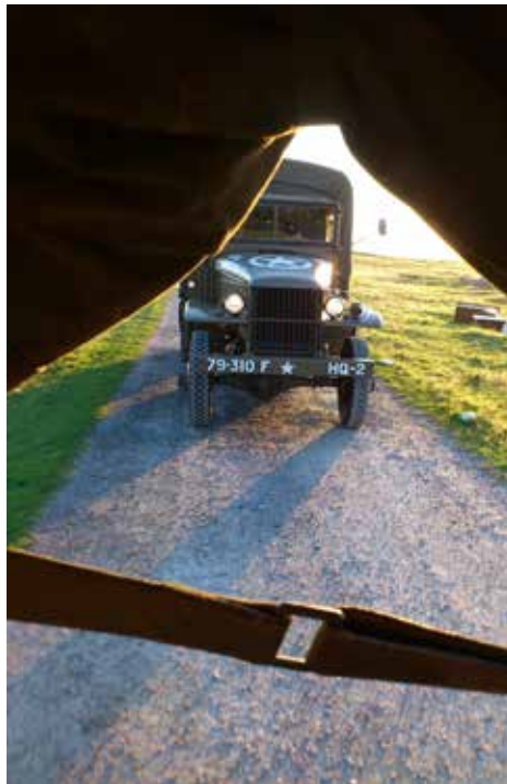
Utsikten när man sitter bak i en liten militär trupptransportjeep