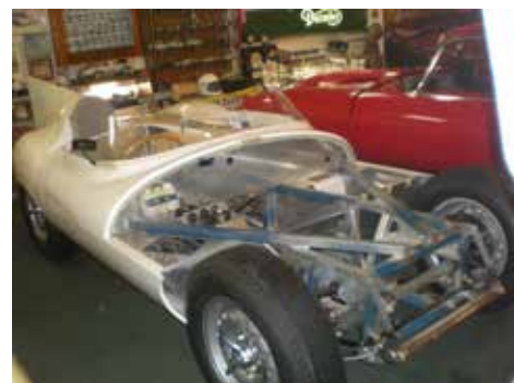
D-typen är ett nybygge från scratch med en glasfiberkaross.