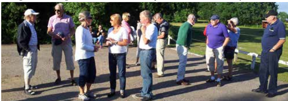
16 juli blev gottesuget alltför stort och resan gick till Glasskiosken Möllegård där italiensk glass av högsta kvalitet intogs med god aptit och under stor njutning.