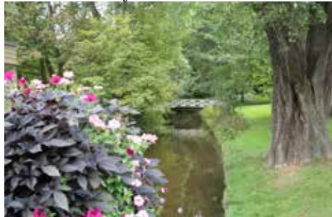
Vy från den vackra Stadsparken