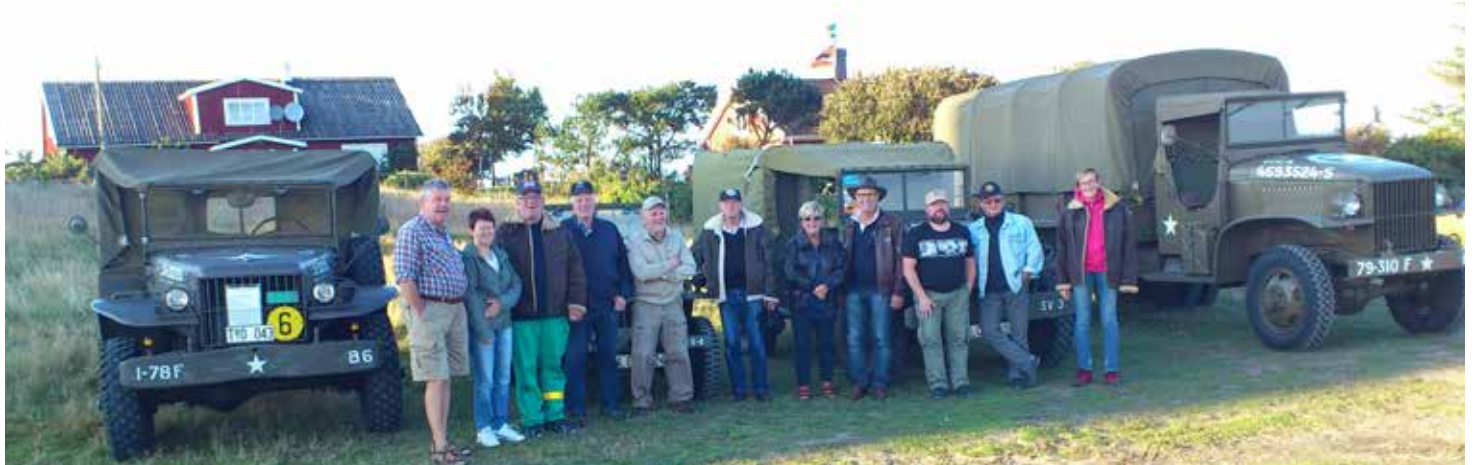
Hela utflyktsgänget samlat tillsammans med de bilar/lastbilar/jeep vi hade till vår förfogande denna utflyktskväll.

Efter det att vi besökt fyren gav sig hela gänget av till Mourps hamn för intagande av medhavd fika samt för att beundra solnedgången över havet. Denna kväll var kanske inte lika ljummen som tidi-