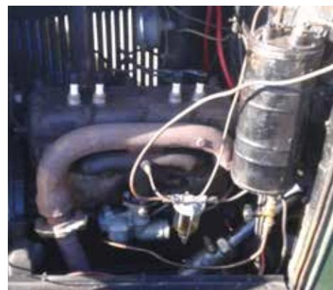
Vakumtanken för bensinen

Bilen har ganska originella tekniska lösningar, som t ex en vakumdriven bensinpump försedd med kran för att öppna respektive stänga bensintillförseln. Bilen är också utrustad med bränslemätare men den var placerad ovanpå tanken så den kan bara ses när bilen står still.