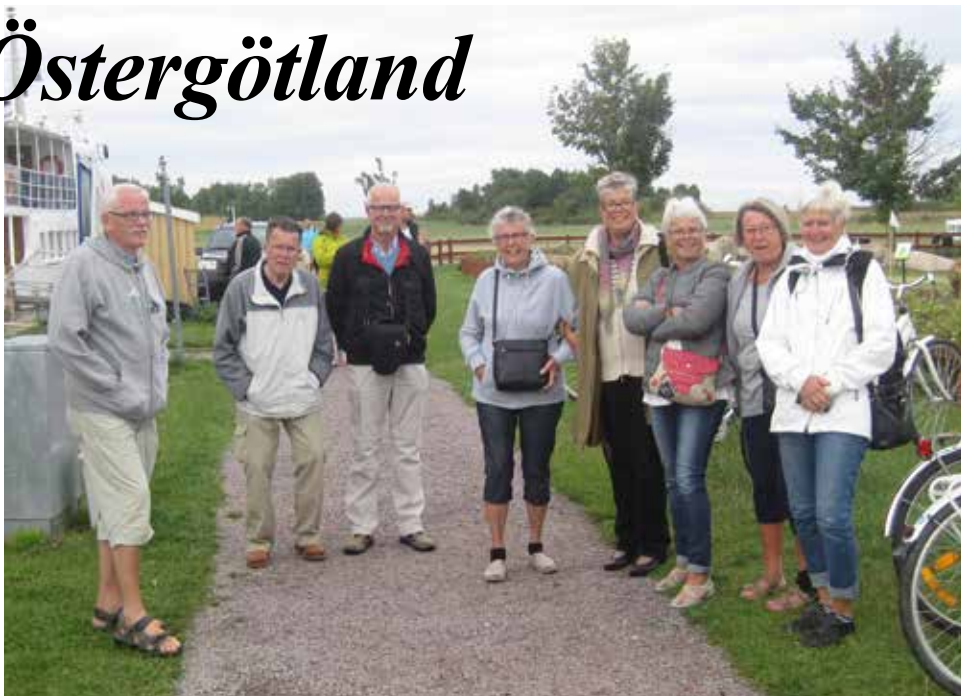
Ett glatt gäng på utflykt, på väg till både bil- och flygmuseum samt kanalbåt.

Fika- och kissepaus var planerad till Brahehus parkering och väl där tog vi en välbehövlig rast innan vi åter steg in i bussarna och styrde mot nästa delmål