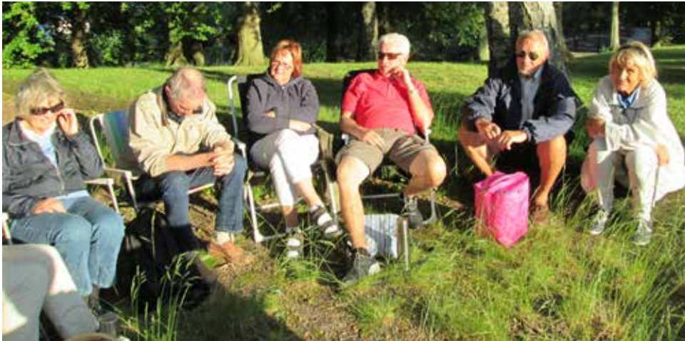
Laholms stadspark 28 maj. I år började onsdagsresorna tidigt, men vi hade ju också en mycket vacker och varm vår. På bilden kan ni se ett antal solnjutande HFV-are