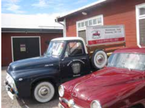
Vid bilmuseet i Motala

I samlad trupp tog vi oss in i museet och