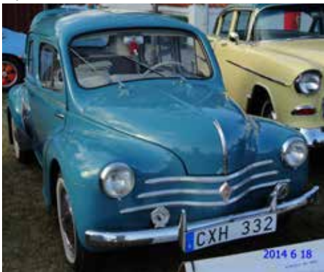
Ögonstenen Renault 4 CV 1960

Först på lagret som springschas o diverse, sedan efter ett halvår ner till dom tuffa bilmekanikerna. Här fick man verkligen uppleva livet som lärling. Man fick slåss för livet, liten och spenslig som man var. Trodde man skulle jobba med motorer, jo, kyss mig i pinjongen, här var det andra bullar som gällde. Polera och färdigställa nya eller gamla bilar eller ut och tappa bilar som skulle stå ute under den kalla årstiden. Nåväl, efter hand blev det till att smörja bilar, tror ni det fanns tryckluft?, nää.