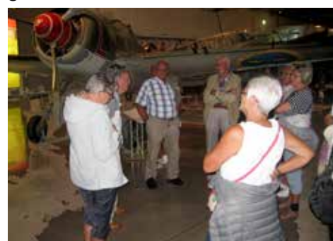
På flygmuseet i Linköping

Nöjda med vad vi sett tog vi oss sedan ut i solskenet, några passade på att äta lunch andra strosade runt eller slappade och åt glass i solskenet innan vi letade oss ut till