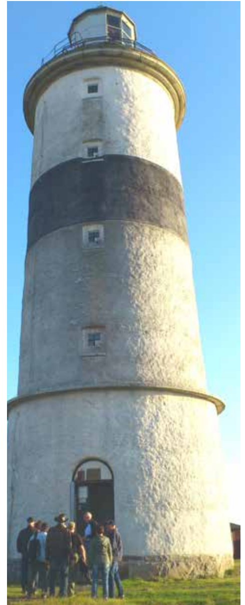
Den är hög och vi blir små