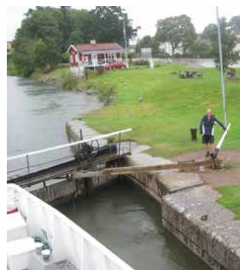
Manuell hantering av slussen

Vid Ödeshög mötte vi regnet som följde oss med olika intensitet hela vägen ner mot Halland. Att det bara kan regna så! Strax utanför Vaggeryd gjorde sig kaffe-