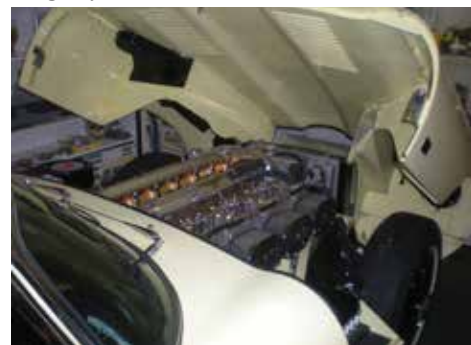
Kan ett motorrum bli vackrare?