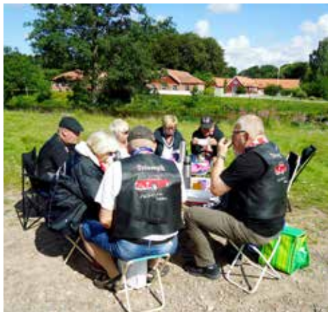
Fikapaus på Gröningen i Laholm på väg ner till träffen i Röstånga

Fem ”Triumphar” gav sig iväg kl 9 från Oskar Svenssons Torg i Tvååker den 28 juli. I bra väder tog vi oss ner till Gröningen i Laholm där andrafrukosten avnjöts. Efter inpackning och toalettbesök åkte vi söderut och passerade Örkelljunga, Perstorp, Ljungbyhed för att checka in på Röstånga Gästgivaregård. Nu strålade solen och vi med den.