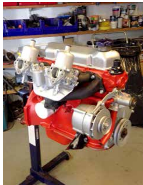
Renoverad och lackad motor