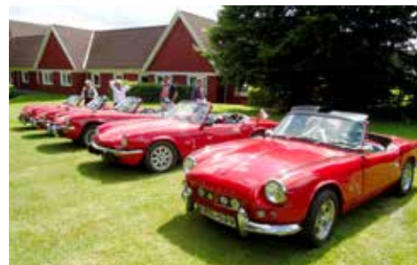
Bilarna på parkeringen utanför Röstånga Gästgiveri