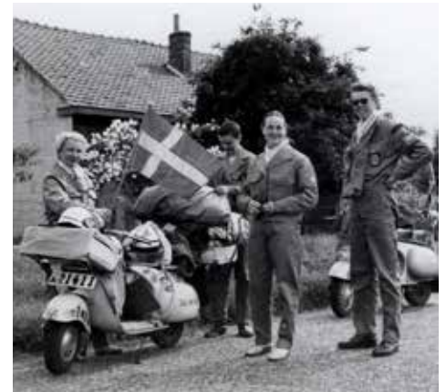
Snart dags för defilering

Om man mötte S-märkta fordon på vägarna vinkade man alltid till varandra. Men det var inte så många svenska turister i utlandet på den tiden. Däremot upptäckte vi överraskande att många tyska bilister, cyklister och andra vinkade så glatt och satte upp några fingrar i luften. Vespogör människor glada!