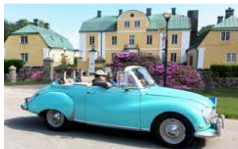
Västkustrallyt, Wapnö Gård