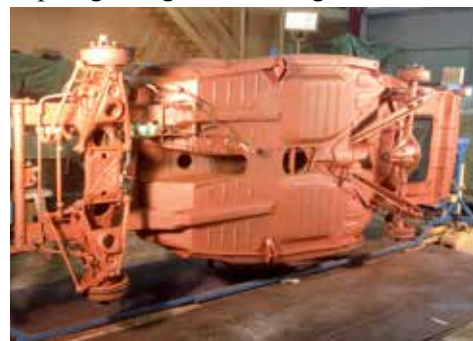
PVn på kaross-snurran

Jag visade intresse för bilen och efter några år blev det affär. Bilen hämtades sommaren 2012 men renoveringen påbörjades inte förrän mars 2015 då jag samtidigt renoverade min Mercedes 230. Det blev ett tidsödande arbete, skrapa inoljaad underredsmassa och tvättning. Kaross-snurran var till stor hjälp då man kunde rotera bilen vid svetslagning, slipning och grundmålning.