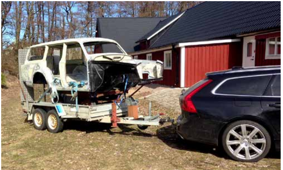
På väg till lack