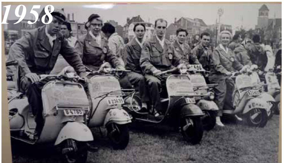
Det svenska Vespa-gänget i sina enhetliga kläder

kläder, bestående av byxor och jacka, lätt tillgängliga på vespan.