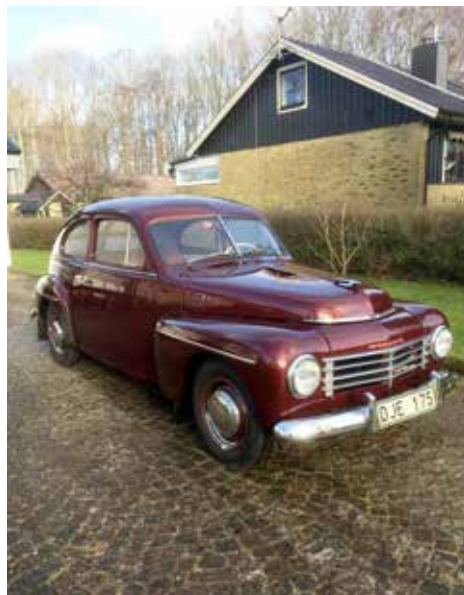
Ihopplockad och besiktningssklar