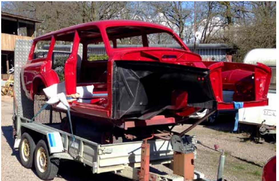
Nylackad i mustigt rött