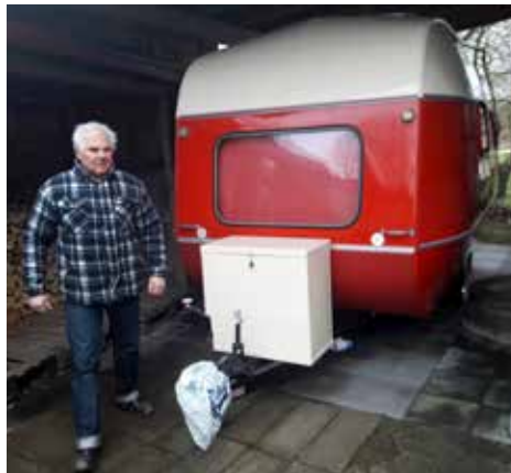
Curth vid Opio husvagn 1968

Oj, det blev många, glömde visst husbilen, ett par MC och Maggans bil för att göra listan helt komplett.