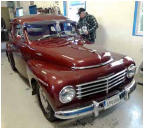
Curths fint revoverade PV 1953

Hans medlemsnummer är 218, vilket borgar för att han varit medlem i Hallands Fordonsveteraner i ganska många år. De flesta känner nog igen honom på den röd vita Chevrolet 2103, 1953 med vidhängande veteranhusbil av märket Opio L 600 och årsmodell 1968 och för ägarnas matchande klädsel i samma färger som ekipaget.