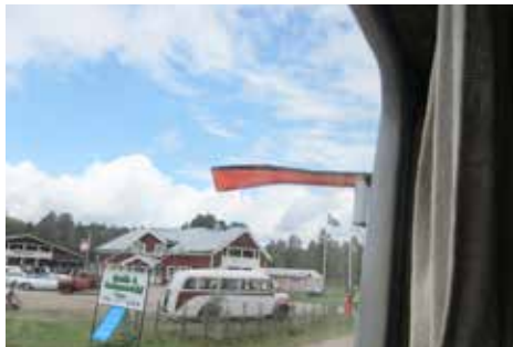
Ser moderna bilister verkligen denna väganvisningspil?

Ett mysigt fik i Retro stil fanns även där. Vi åkte en liten tur med en buss från 1934. Den var ihopsatt med en förarhytt från en brandbil och en bussdel som nästan var helt orörd. Första ägaren körde "Kyrkfolk" på söndagarna, på vardagarna kopplade han bort bussdelen och hade ett annat flak där han körde grus.