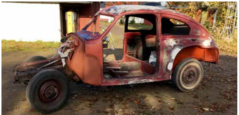
Det blev en hel del rostlagning innan bilen var klar för lack