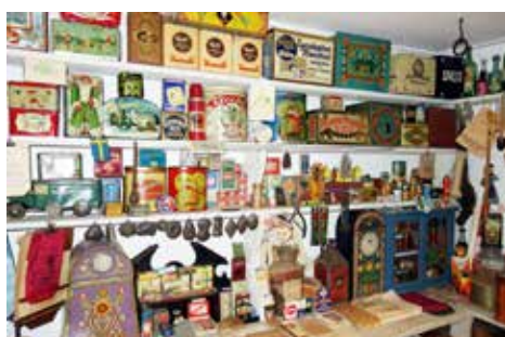
Inredning från en gammal handelsbod