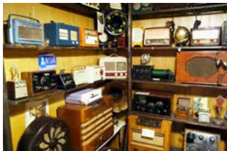
Gamla fina radioapparater i mängder