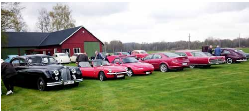
En tämligen gråmulen dag denna 1 maj. Här parkeringen vid Hembygdsgården.

Hembygdsgården i Tvååker var vårt utflyktsmål denna 1 maj och det blev en riktigt trevlig upplevelse att få vandra