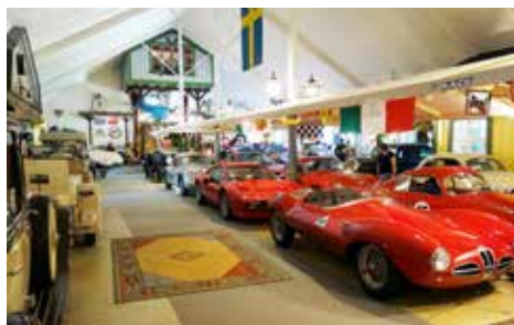
Smålands bil och leksaksmuseum