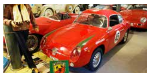
Abarth Zagato 750 cc, Serie III, 1959