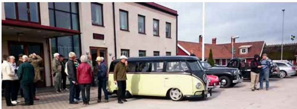
Vi träffades på Medborgarhusets parkering i Tvååker