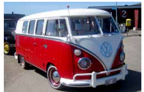
Arne fotograferade en vackert renoverad VW-buss från 1958