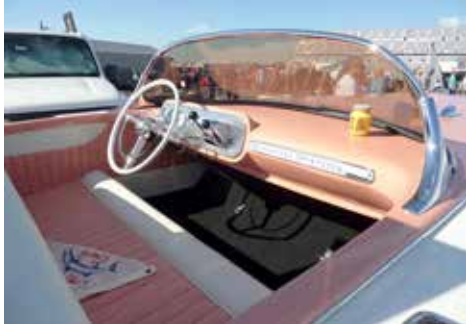
Daytona båt, årsmodell 1958

Vi kom till Orlando på torsdagskvällen, letade upp vår hyrbil och åkte till hotellet som vi skulle övernatta på. På morgonen, tidigt efter frukost stack vi ut på vägen till Moultrie, tog cirka 3 timmar att köra upp till första Swap Meet. Första helgen med värme på 23-25 grader.