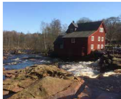
Kvarnen i Knäred

Den 19 april började säsongen för moppekörningarna i Laholm med omnejd.