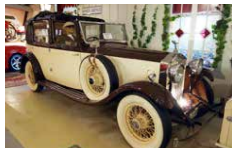
Rolls Royce i ett makalöst fint skick