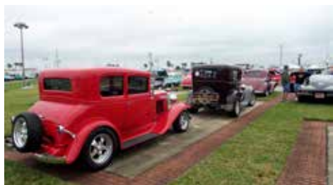
Hotrod i Daytona

Nästa stad vi landade i var S:t Augustine,