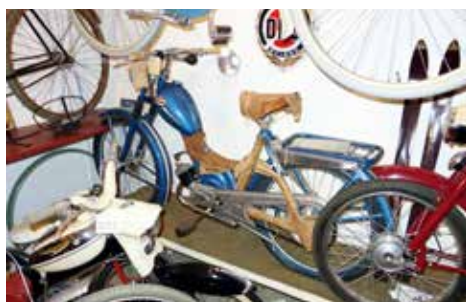
Fabriksny Monark ILO, pris 760 kronor 1953