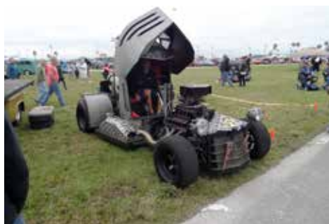
En alldeles unik "Hjämbil"

På kvällen rullade vi ned till Daytona Beachvägen där det var cruising, inte som i Sverige men det blev en trevlig kväll med bilar och en julkonsert i bakgrunden. Vi lyssnade på den och V8-ljudet i värmen och kvällen blev mycket bra. Amerikanarna gillar sina pickuper, många var höga med neonlyse under hela bilen, kanske inget vi tycker om men det var fint i mörkret.