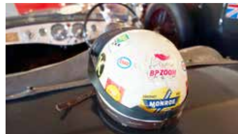
BP, Shell, ESSO och Koppartrans. Visst var dekalerna snyggare förr. Även om hjälmarna verkligen inte var bättre förr.