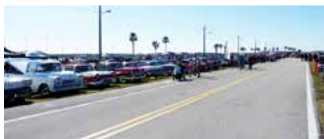
Mängder med bilar i Daytona

Så hamnade vi i Daytona beach i Florida på Turkey run meet på Daytona race Way banan där normalt Daytona 500 går av stapeln. Det börjar på torsdag och håller på till söndag och det är så mycket som 6000-7000 bilar i helgen. Vi kom dit på fredagen och började gå runt på den gigantiska marknaden. Ett antal timmar gick vi och tittade på alla bilar som var där, överallt på området. Tyvärr var marknaden inte bra och det var mest krimskrams, men bilarna var mycket bra. Den påminde om den dåliga marknaden på Power Meet i Sverige.