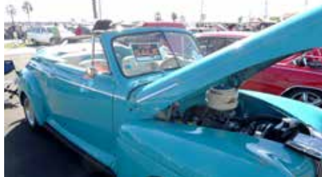
Bil till salu i Daytona

Det behövdes 2 dagar för att hinna med ordentlig. Denna träff arrangeras också på våren men många sa att den är bäst i november. Även dom som sålde sa samma sak.