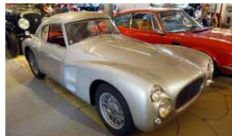
Fiat 8V 2 L från 1953