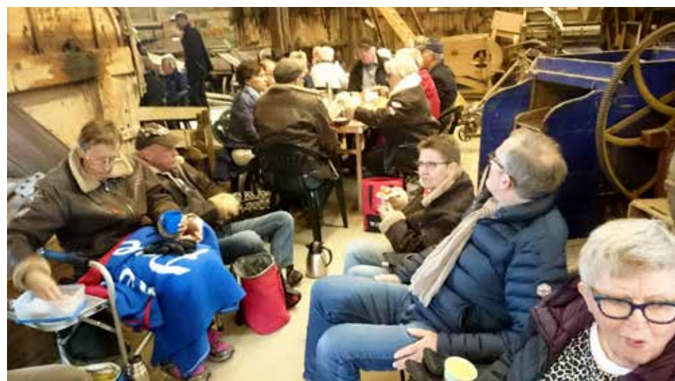
Medhavd kaffekorg intogs i hembygdsgårdens vindskyddade lada