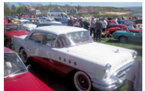
Ett myller av bilar och folk