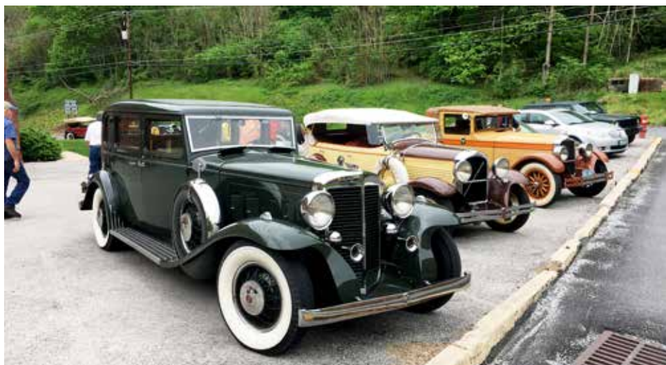
Parkeringen rymde ett flertal exklusiva bilar. Närmast en Marmon från 1932