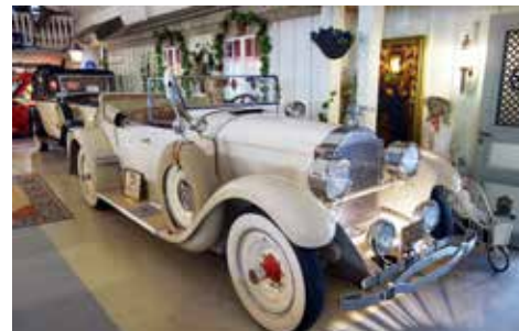
Packard Roadster 1928