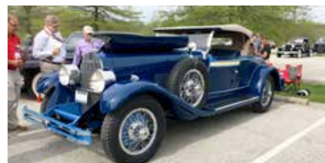
En Dupont från 1929 väckte stor uppmärksamhet hos domarna

Innan den stora dagen med bilar fick vi några härliga dagar med guidad tur i Gettysburg. Staden där det visades kanon/gevärs-kulor som fortfarande satt kvar i träd och tegelstenar från inbördeskriget och det stora slaget där 1863. Mycket intressant.