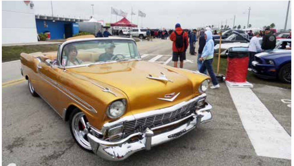
I Daytona såg vi denna läckert renoverade Chevrolet

Under första dagen blev en del köpt som passar i resväskan. Tyvärr så får man tänka på vikten, annars tror jag det skulle kunna lösas med att skicka hem med posten. Detta blir billigare än att beställa från Sverige där vi får betala tull o moms. Området tog en dag att gå igenom. Det