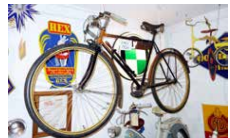
En OPEL från 1926!