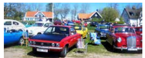
Opel och Mercedes i första ledet