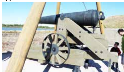
I Fort Jackson Savannah såg vi denna imponerande kanon

USAs äldsta stad. Där var mycket att se bl a de gamla bevarade byggnaderna. Gågatans affärer är belägna i de gamla husen på gatan. Det var hus från 1600-talet och framåt, inget nybyggt här inte. Det blev väldigt mysigt. Thanksgiving var denna helg och då är det ett måste att äta kalkon m.m. Black Friday på kvällen vid 18.00 och nästan inget var öppen innan.