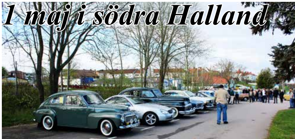
Vi träffades på Gröningens parkering i Laholm.