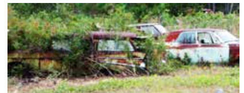
Vi passerade en bilskrot i Georgia

Nu hade vi en vecka till nästa inplanerade