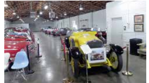
Bilförsäljning i Savannah

Efter detta tittade vi på bilar men nu är