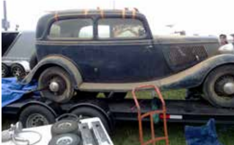
Bil till salu i Daytona

Det fanns även mycket retrodelar men huvuddelen var bildelar. Ej lika mycket krimskrams som i Sverige.