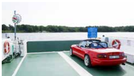
Färjan över till Bolmsö

Snyggt, pryddigt och välfyllt hos Smålands bil och leksaksmuseum