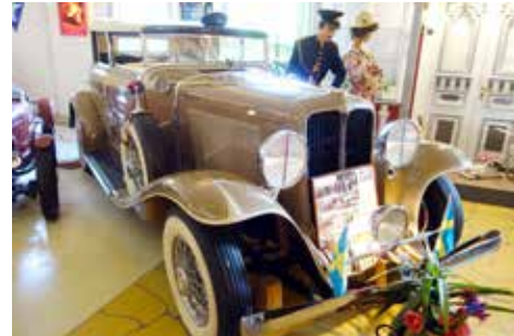
Auburn som vår nuvarande kung och drottning har fått åka med i