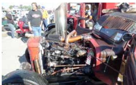
Byggd på vad som fanns i garaget