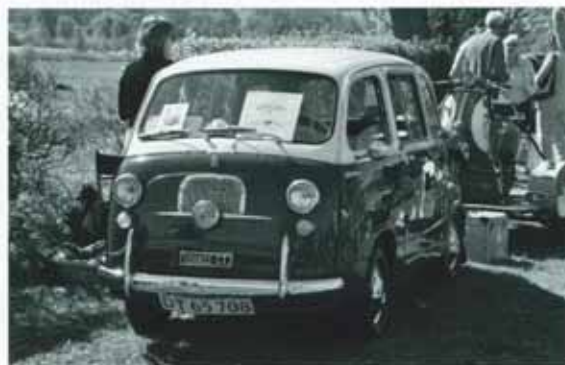
Fint besök på Skottorps slott av en dam, från Danmark med sin Fiat 600 Multipla samt en Vespa på släpet. Italienskt så det förslår.

Här fanns mycket från Fordson och Case från 30-talet till våra vanligaste "Grällar", Volvo T BM Viktor, Krabat m m från 50-60-tal. Allt var i körbart skick och många provstartades. Efter att Erik avtackats med en blomster-upsats bar det av till motell Hallandsås för mat och inlämning av den kluriga flagg- och bilfrågetävling som Roger konstruerat. Vid den efterföljande prisutdelning kunde Falkenbergaren och Midgetfolket dela på förstapriset, varsin startavgift till Västkustrallyt.