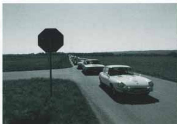
Karavanen på vägen sydost om Skottorps slott. Här ledd av Jaguar E-type.