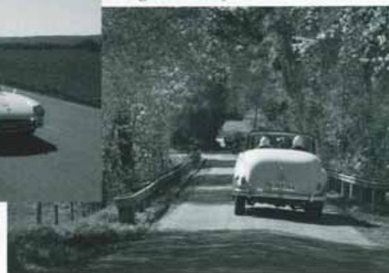
Väckert rundad bak på en Daimler Cunquest Century 1955 i vårsolen på vägarna runt Lya.