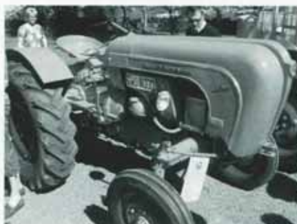
Två av Erik Nilssons traktorer i Lya. Två en tysk Allgaier AP 22 samt en Case 38 Fotogenare nedan.