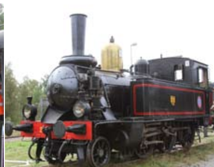
Två bilder från tågdagarna i Landeryd den 3 och 4 sept 2011.