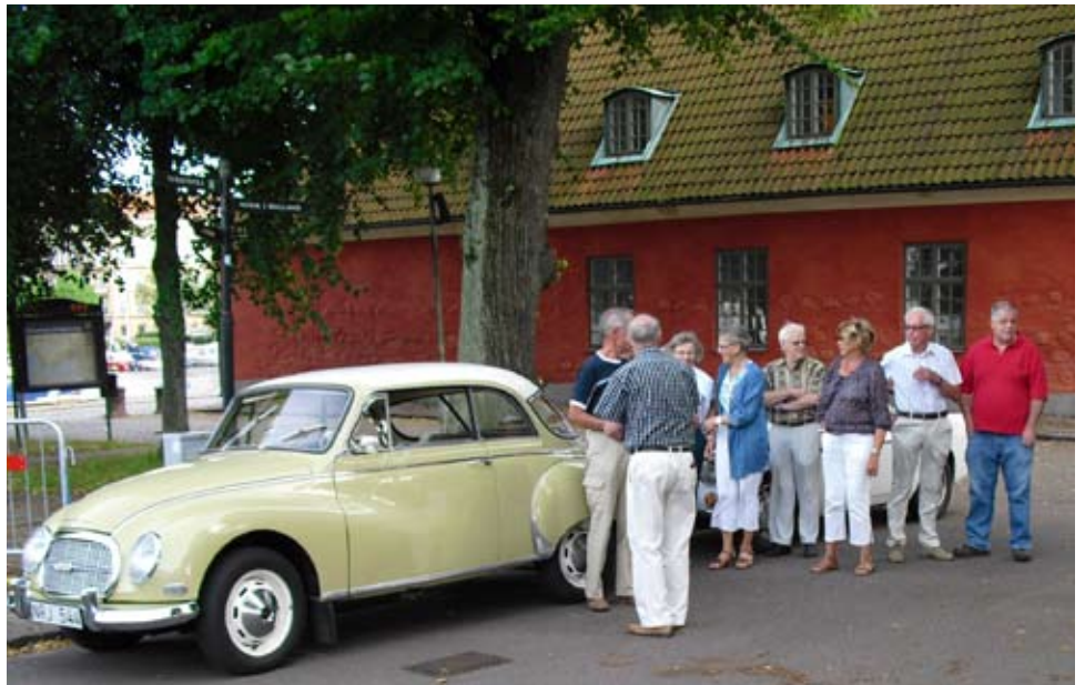
Samling framför slottet i Halmstad 27 juli Laxbutiken Laholm