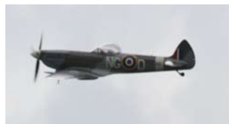
Biltema bjöd på flyguppvisning med en Spitfire från 2:a världskriget