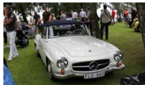
Per kör själv Mercedes så naturligtvis var detta märke ett attraktivt fotoobjekt