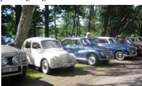
Parkering på Galgberget