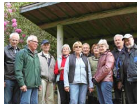
30 maj, Vargarslätt i Simlångsdalen.