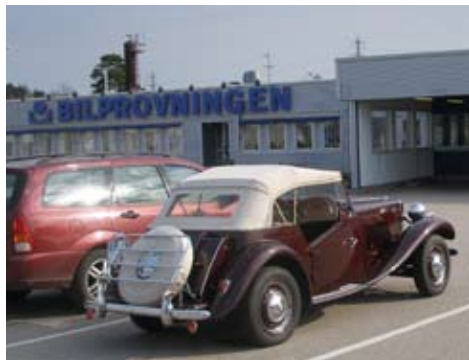
I spänd väntan på besiktningen