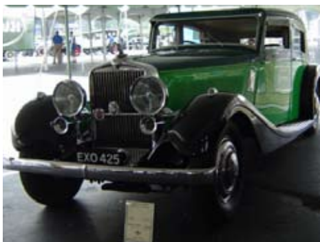
Ordförande Normans bil

Det var en upplevelse att få träffa alla dessa människor, dela deras intresse för fordon och lyssna till otroliga berättelser om hur dom hitta sina bilar. Dessutom få veta hur mycket tid OCH pengar dom lagt ner på sina älskade klenoder. Det visar hur dedikerade dom är till sina älskade STuTZ.