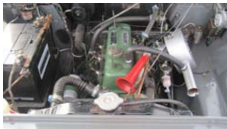
Ett välputsat motorrum

Alla papper och handlingar från att bilen nysåldes finns bevarade, till och med alla verktyg som följde med bilen som ny finns snyggt förvarade i bagageutrymme.