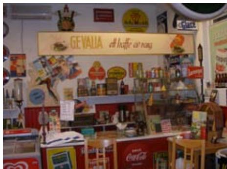
Interiörbild från 50-tals fiket

när man kliver in en nu förgången och aldrig mer återkommande tidsmiljö. En tid att längta tillbaka till, en tid när framtiden låg framför en.