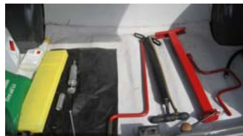
Alla verktyg finns kvar

Så till Bertil's ovanliga veteranbil, en Austin A 60 Cambridge av årsmodell 1962. Sådana bilar var vanliga på 60-70 talet men inte många bevarades till eftervärlden. Detta exemplar är tämligen unikt! Bara 3170 mil sedan den såldes ny hos Eric Fagermans i Varberg.