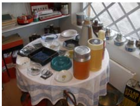
Interiör bild med nostalgia

man alltid diskutera men att tanka var enklare förr. Det var bara att köra fram till pumpen, veva ner rutan och sticka ut en sedel och be servicemannen att tanka