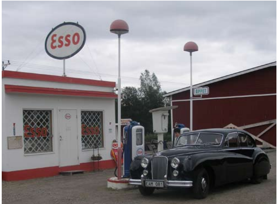
Stig Borgs nostalgimack i Järvsö

Och visst blev det lyckat. Man får nästan tårar i ögonen av sentimentala minnen