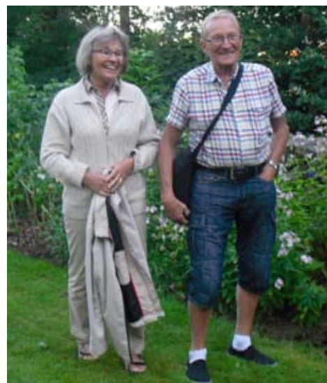
Även arrangören och fotografen lyckades komma med på en bild