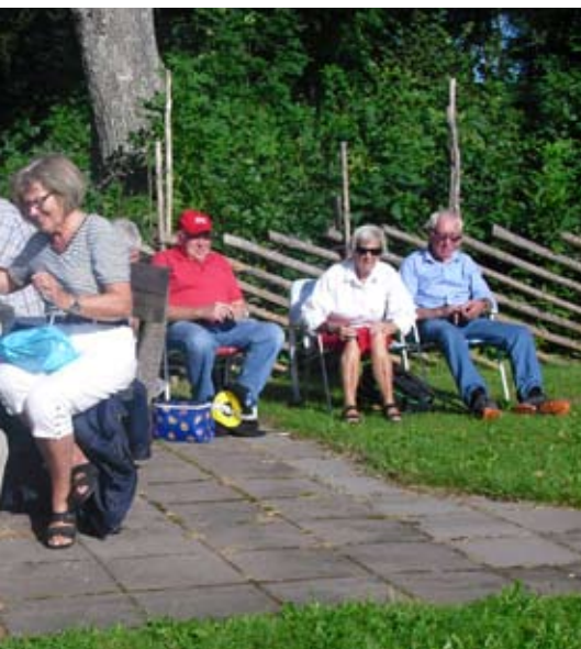
... man gör en utflykt