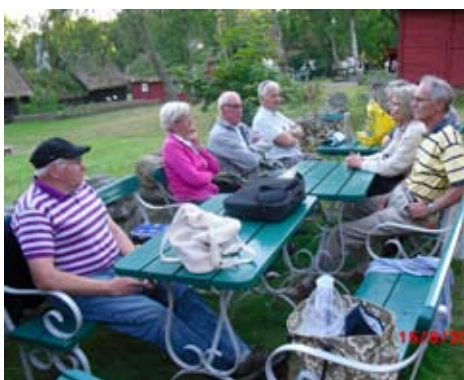
Vilar några minuter efter vandringen på Galgberget i Halmstad