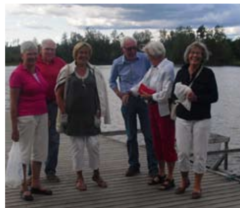
Trivsamt på Tiraholms brygga