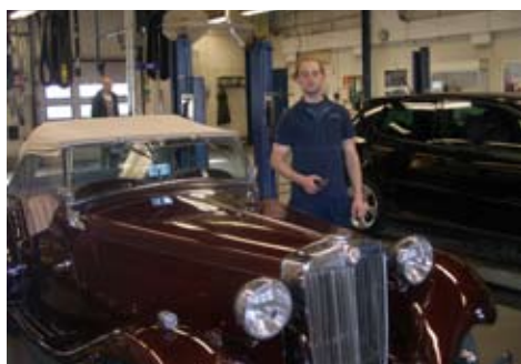
Allt gick bra, även CO-halten blev godkänd, kanske för att förgasarna justerades precis före besiktningen. Inte för att det egentligen behövs då bilen ska godkännas ändå med det lägsta värdet den kan ha för att gå utan driftstörning. Nu fick jag justera förgasarna även efter bilprovningen.