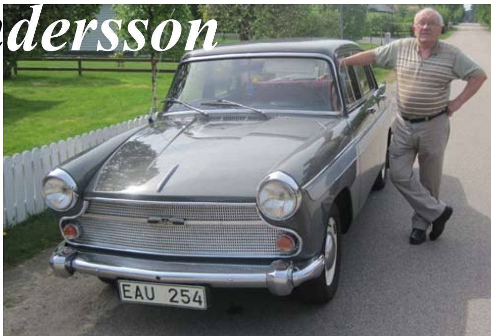
Medlem nr 99 Bertil Andersson med sin fina Austin A 60 1962

Så under åren 1990 till 2000 så ägdes bilen av Bertil, men... den blev inte klar. Men sedan hände det saker. Efter att Bertil pensionerat sig från Rejmes blev det mer tid att meka med Austinen och