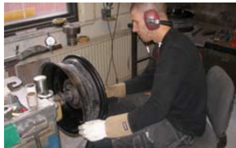
Fälgen mäts upp

När man i sakta mak vagnar sida till sida eller guppar upp och ner är det dags att kolla hjulbalanseringen och det gör man hos en däckfirma. Det var precis det jag gjorde när min bil började bete sig egenomligt. Det visade sig att en fälg blivit skev och var omöjlig att balansera. Rådet jag fick var att kontakta Fälgfixarna i Helsingborg, vilket omgående gjordes. Väl där mättes fälgen upp i en speciell maskin och det konstaterades att den både behövde riktas och svarvas. Efter