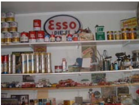
Välfyllda hyllor med nostalgiprylar

Det han inte hade i sina egna gömmor har han letat upp hos andra, ibland köpt men mycket har också donerats av samlare och nostalgiker.