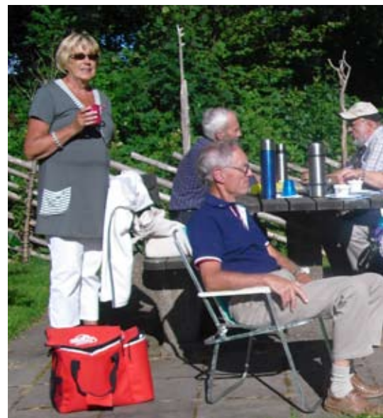
Medhavd kaffekorg smakar alltid utmärkt när