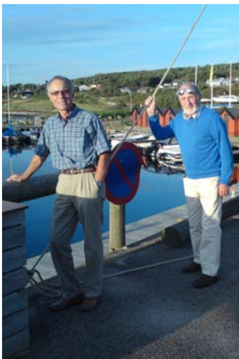
Utflykt till Haverdals hamn