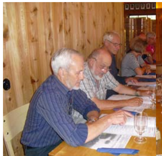
Deltagare i utfärden till Bolmsö studerar men