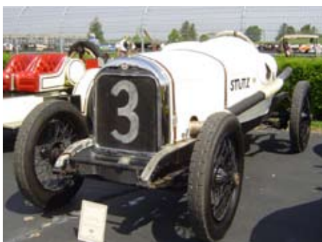
Gregor Tarjans bil

Efter mycken möda och stort besvär fick han bilen klar precis lagom till träffen