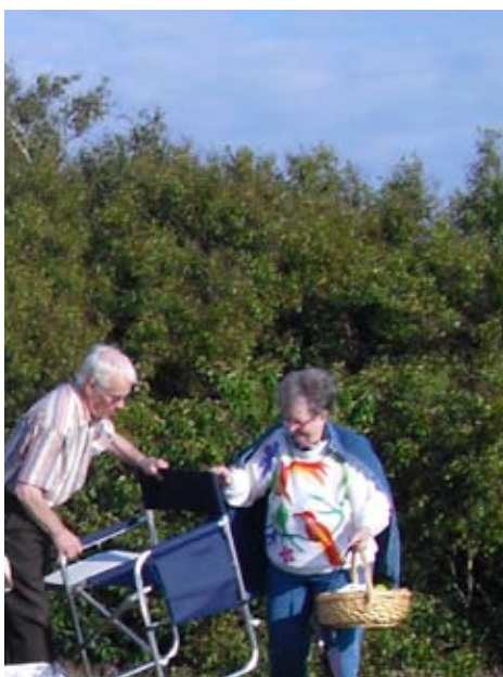
Bättre sent än aldrig