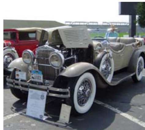
En bekväm racerbil

Goda middagar och mingel var också en del av det hela. Det delades ut priser till flera av medlemmarna, äldst bil,