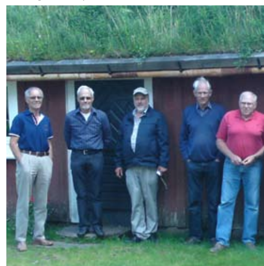
Hembygdsgården i Odensjö var ett av alla utflykter