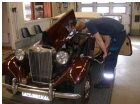
Är det rätt bil, besiktningsmannen letar efter chassissnummer