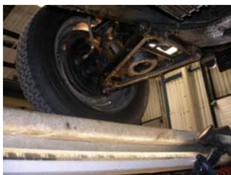
Uppe på liften kollas spindelbultar, hjul-lager och andra möjliga felställen som kan vara trafikfarligt att köra omkring med