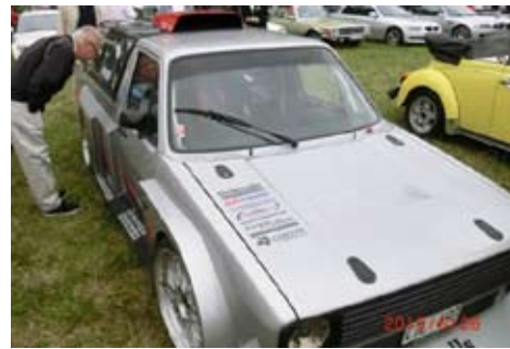
En specialbyggd VW Golf intresserade