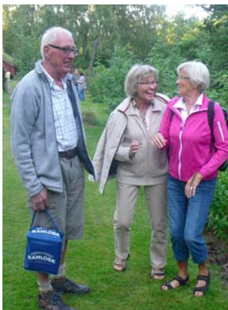
Flickorna har roligt på utflykten