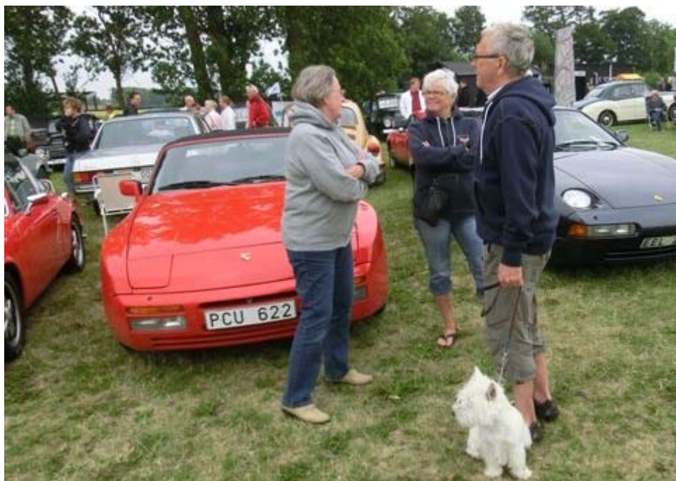
Några välkända HFV-profiler som fastnat på bild