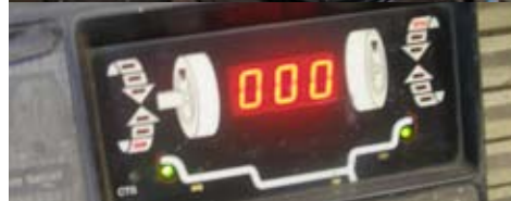
Perfekt balans ger 0-or i displayen