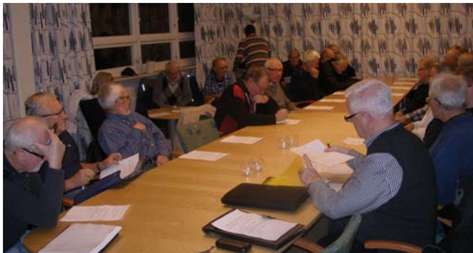
Det kom så många medlemmar att konferensbordet inte räckte till

Medlemmarna måste ta sitt ansvar så någon. Men av de närvarande var det bara två som signalerade att de möjligt-