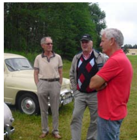
På parkeringen vid hembygdsgården i Unnaryd under marknadsdagen.