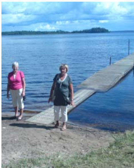
En riktigt lång brygga ut i Bolmen