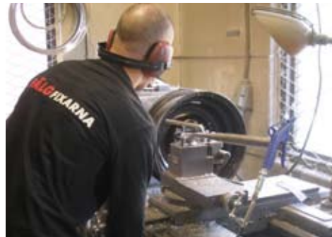
Fälgen placerad i den stora svarven

vistelsen i Helsingborg var det dags att montera på däck igen samt balansera hjulet, vilket jag lät A-däck i Åled göra. Resultatet? Se bild nedan!